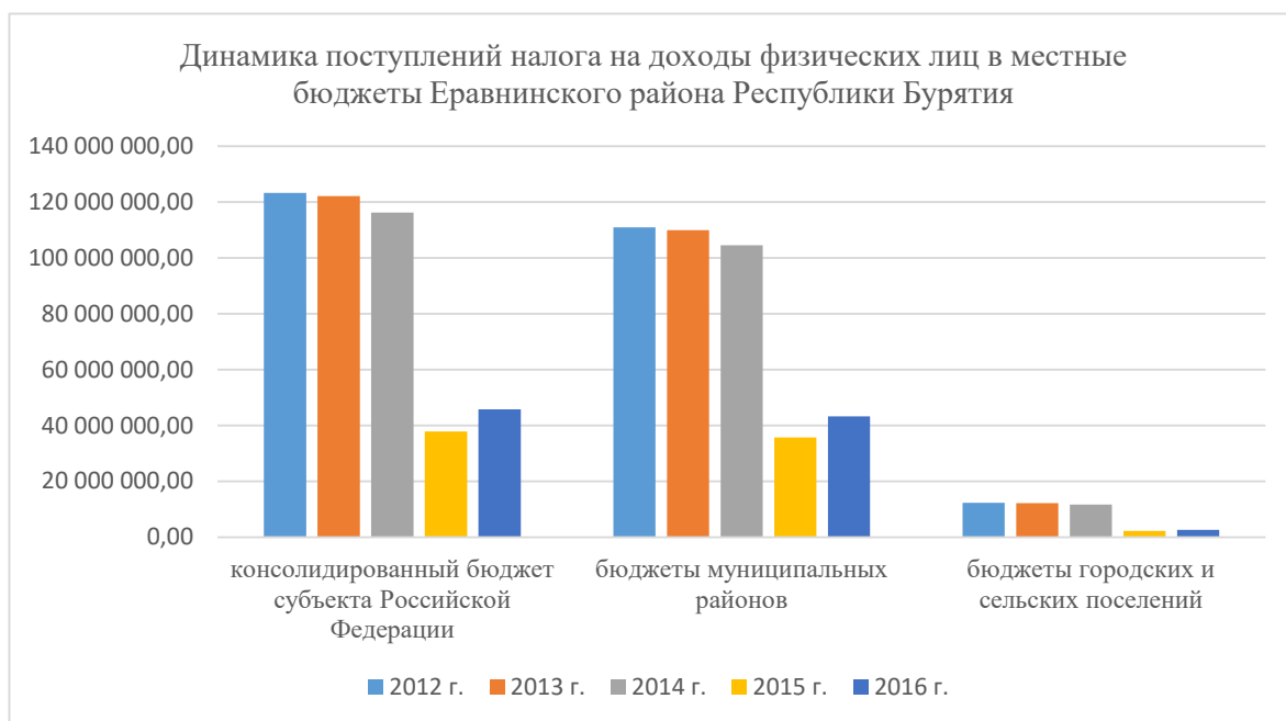
Рисунок 2 - Динамика поступлений НДФЛ

Исходя из анализа динамики суммы поступлений НДФЛ, мы пришли к выводу, что с 2012 г. по 2015 г. наблюдается тенденция снижения показателей темпов роста лишь 99,09% до 32,59%. В 2015 году мы можем увидеть, что происходит резкое сокращение поступлений НДФЛ от 116 219 364,9 руб. в 2014 г. до 37 873 753,1 руб., это в 3,07 раза меньше показателя в 2014 г.