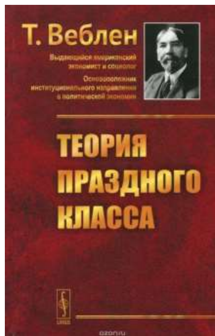
Т. Веблен «Теория праздного класса», 1899 г.

Т. Веблен считает, что именно бескорыстное и праздное любопытство является основой всякого исследования и в конечном итоге приводит человека к важнейшим открытиям, а родительское чувство как альтруистический инстинкт перерастает в заботу о благе целого общества. Но затем эти внутренние чувства вступают в конфликт с социальными институтами, которые имеют свои запреты, свои ограничения человеческой деятельности. Как уже было сказано выше, институты способны изменяться, но изменяться они могут очень и очень долгое время.