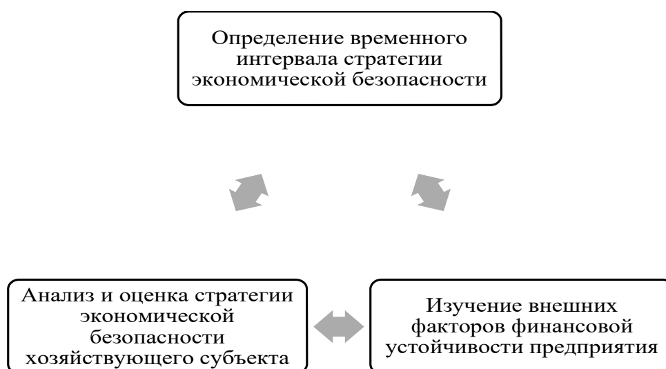
Рисунок 5-Этапы разработки стратегии экономической безопасности

Кроме того важно проводить анализ альтернатив в части наиболее значимых финансовых решений, а именно тех, которые будут оказывать наибольшее влияние на достижение планируемых параметров. На рисунке 5 отражены основные этапы разработки стратегии экономической безопасности хозяйствующего субъекта.