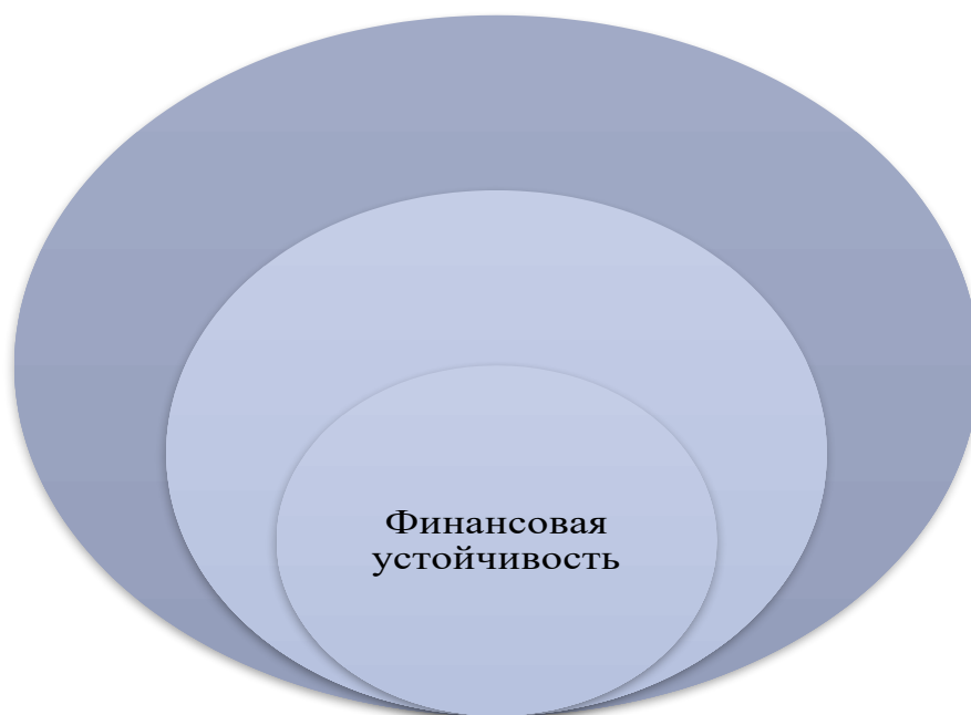
Рисунок 2- Положение финансовой устойчивости в системе экономической безопасности

Таким образом, финансовая устойчивость предприятия является центральным элементом системы экономической безопасности (рисунок 2).