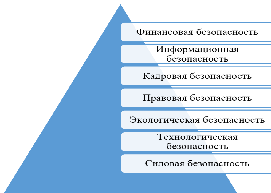
Рисунок 1-Составляющие экономической безопасности

В состав экономической безопасности входят следующие составляющие, представленные на рисунке 1.