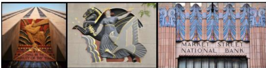
Рис. 22, 23, 24 абсолютное воплощение стиля американский Ар-Деко