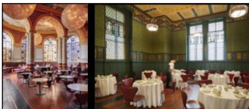
Рис.9, 10 Интерьер кафе в здании Музея Виктории и Альберта, Лондон

Ранний модернизм «венские мастерские» начало 20 века.