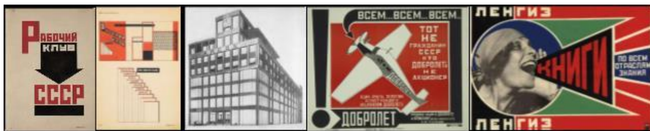
Рис. 28-32 Проект «Рабочего клуба» А.Родченко.

Макет павильона СССР на Международной выставке современных декоративных и промышленных искусств в Париже, 1925 г. Архитектор К. Мельников.