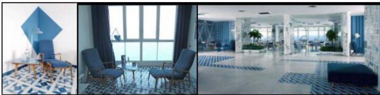
Рис. 33,34, 35 Джованни (Джо) Понти, интерьеры отеля “Parco dei Principi”, Сорренто (Италия). 1962 г.

В эпоху новейшего времени в среде города, появляются шрифтовые вывески, их можно отнести к визуальным коммуникациям отображаемые посредством полиграфических изделий, световых проекционных технологий и интерактивных экранов, которые позволяют воспринимать информацию и ориентироваться визуально. [3]