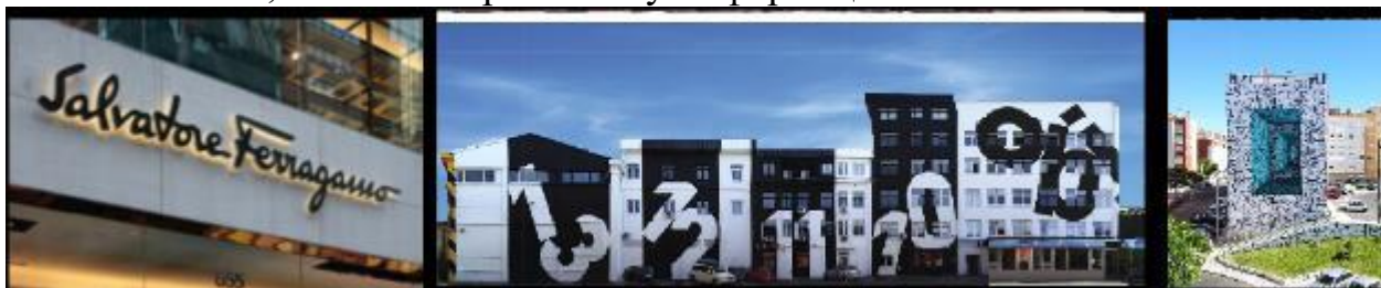
Рис. 40, 41,42 Современные вывески с подсветкой, шрифтовые композиции

Визуальная коммуникация далеко не причуда, она всегда была с нами. Она встроена в наш мозг и помогает нам легче и быстрее понимать новые понятия, а затем сохранять эту информацию.