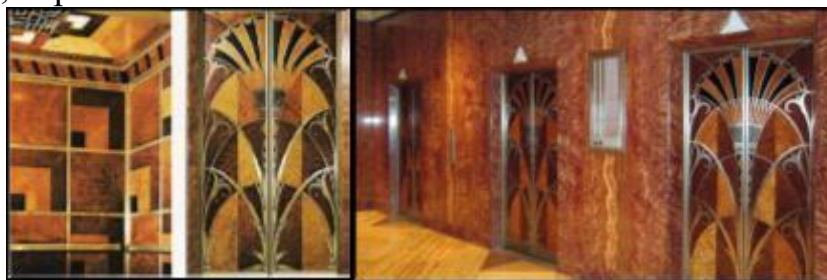
Рис. 19,20,21 Обращение к теме Древнего Египта в оформлении фасада и интерьеров здания

● эклектизм ● монументальность ● абстрактность ● заимствования из древних культур (Др.Египет, Месопотамия, Древняя Греция, «доколумбова» Америка) ● экзотизм ● влияние модернизма ● геометричные формы, ступенчатость ● влияние промышленных форм ● влияние кубизма (граненые, faceted формы) ● использование металла (алюминий, нержавеющая сталь) ● любовь к роскошной отделке и материалам - эмаль, инкрустации по дереву, кожа акулы и зебры ● контрастность, черно-белая гамма