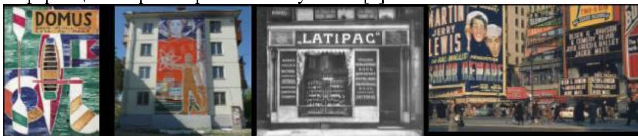
Рис. 36-39 Плакаты, вывески, баннеры

В эпоху новейшего времени в среде города, появляются шрифтовые вывески, их можно отнести к визуальным коммуникациям отображаемые посредством полиграфических изделий, световых проекционных технологий и интерактивных экранов, которые позволяют воспринимать информацию и ориентироваться визуально. [3]