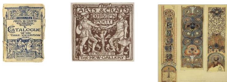
Рис.5 Эскизы для Владимирского Кафедрального собора. Виктор Васнецов.