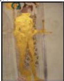
Рис. 11 Фрагмент «Бетховенского фриза» Густава Климта