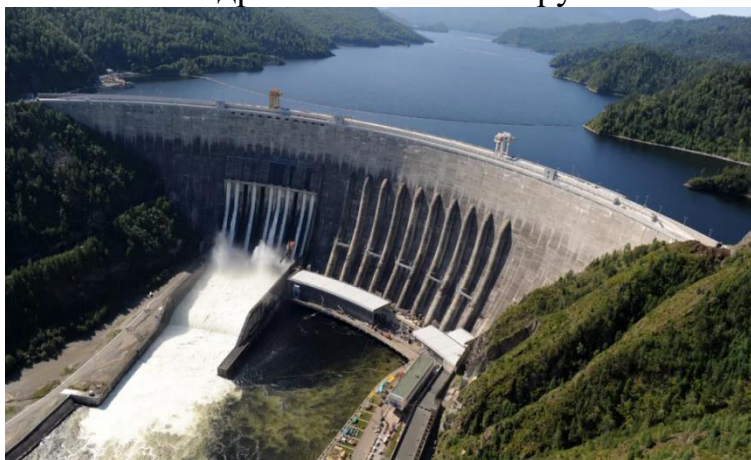
Рис.1 гидротехническое сооружение

Исходя из этих соображений, в июле 1997 года в Российской Федерации был принят Федеральный закон № 117 "О безопасности гидротехнических сооружений". За последние два года был реализован закон и проделана большая работа по усилению безопасности гидротехнических сооружений в целом путем внедрения государственной инспекции безопасности гидротехнических сооружений.