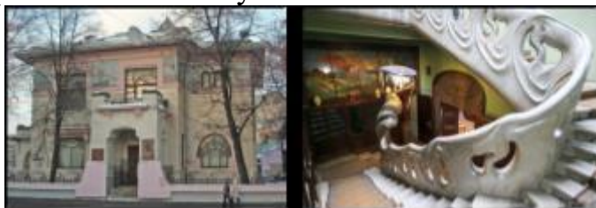
Рис. 15, 16 Федор Шехтель, особняк Рябушинского, 1900-03 г

Первые официальные публикации печатного дизайна в Европе в конце 19 века, особенно в Англии, ознаменовали отделение графического дизайна от изобразительного искусства.