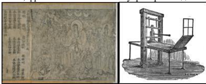
Рис.1 Образец первой печатной книги – Алмазная сутра от китайской династии Тан, 868 год н. э.

подвижными литерами. Первый образец печатной книги, был произведен в 868 г. н.э. в Китае, фронтиспис Алмазной сутры времен династии Тан.