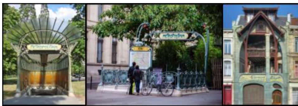
Рис. 6,7,8 Работы Эктора Гимара