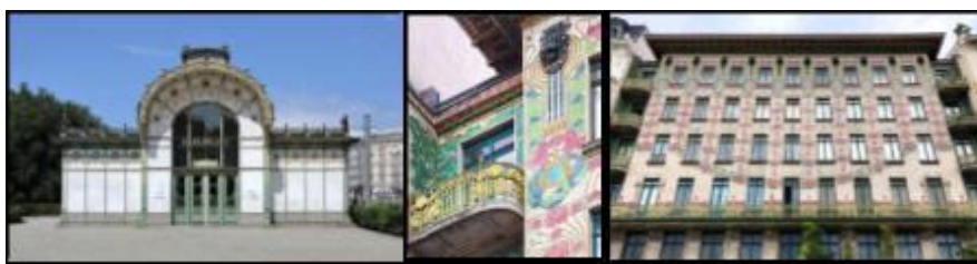
Рис. 14 Архитектурные проекты в Вене, 1900г.

На первом этапе своего развития графический дизайн в России в общем смысле сформировался в 1917-1922 годах на пересечении производственного и пропагандистского искусства. Главной целью было художественное оформление новых форм общественной активности масс, таких как политические марши и уличные праздники. Оригинальная композиция и расположение стендов, агитационных и театральных установок, киосков доказали обоснованность смещения акцентов с разработки новых стилистических приемов на художественно-конструктивные вопросы. В 1920-е годы советский конструктивизм применил "интеллектуальное производство" к различным сферам производства. Движение рассматривало индивидуалистическое искусство как устаревшее в революционной России и перешло к созданию объектов утилитарного назначения. Они проектировали здания, театральные декорации, плакаты, текстиль, мебель, логотипы, доски меню и т.д. Востребованность дизайна как нового искусства потребовала новой подготовки специалистов: в 1918 году в Ленинграде был открыт Высший художественно-технический институт (ВХУТЕИИ). В 1926 году в Москве на базе Высшей государственной художественно-технической студии (бывшей Императорской Академии художеств) был открыт Высший художественно-технический институт (расположенный в Доме Юшкова). Брусковский архитектурно-художественный институт), основанный в 1920 году." [4]