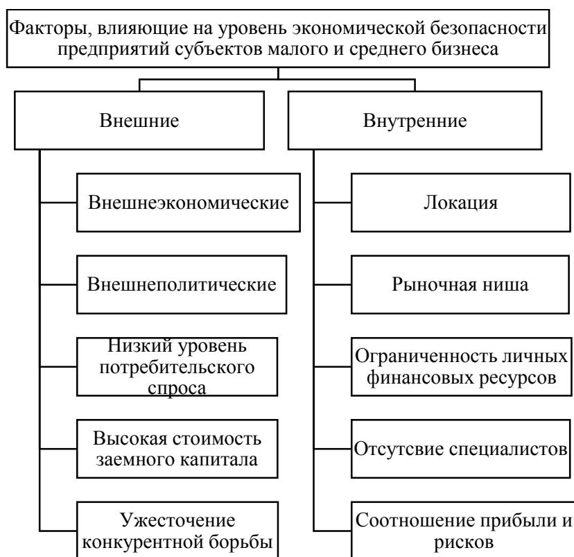
Рисунок 3- Факторы, влияющие на уровень экономической безопасности малых и средних предприятий