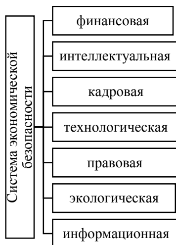
Рисунок 2- Элементы системы экономической безопасности субъектов малого и среднего бизнеса

Фактически система экономической безопасности субъектов малого и среднего бизнеса включает в себя структурные элементы, представленные на рисунке 2.