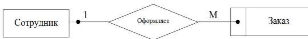
Рисунок 1 – Диаграмма ER-типа

Второй этап – проектирование диаграмм ER-типа с учетом всех сущностей и связей между ними. Фрагмент диаграммы ER-типа представлен на рисунке 1.