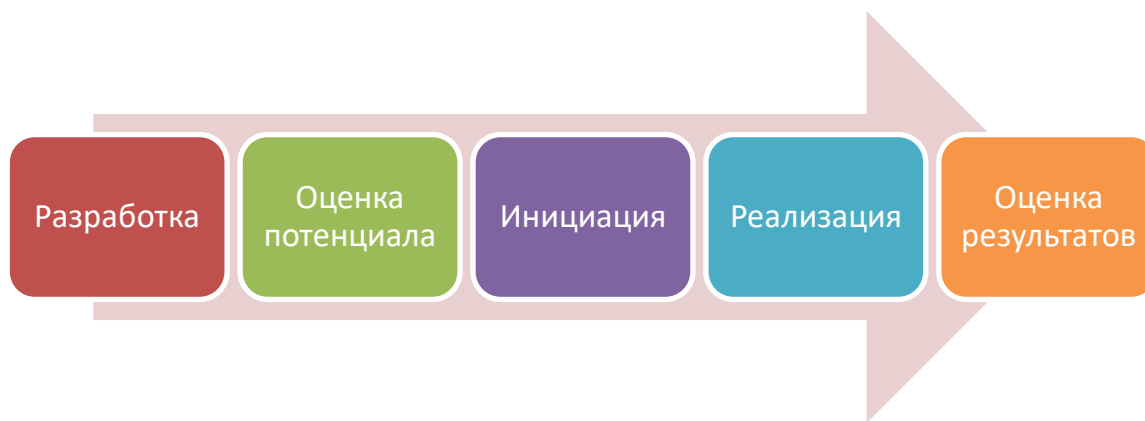
Рисунок 2 - Процесс разработки региональной программы социально-экономического развития

На этапе разработки региональной программы социально-экономического развития осуществляются следующие действия: