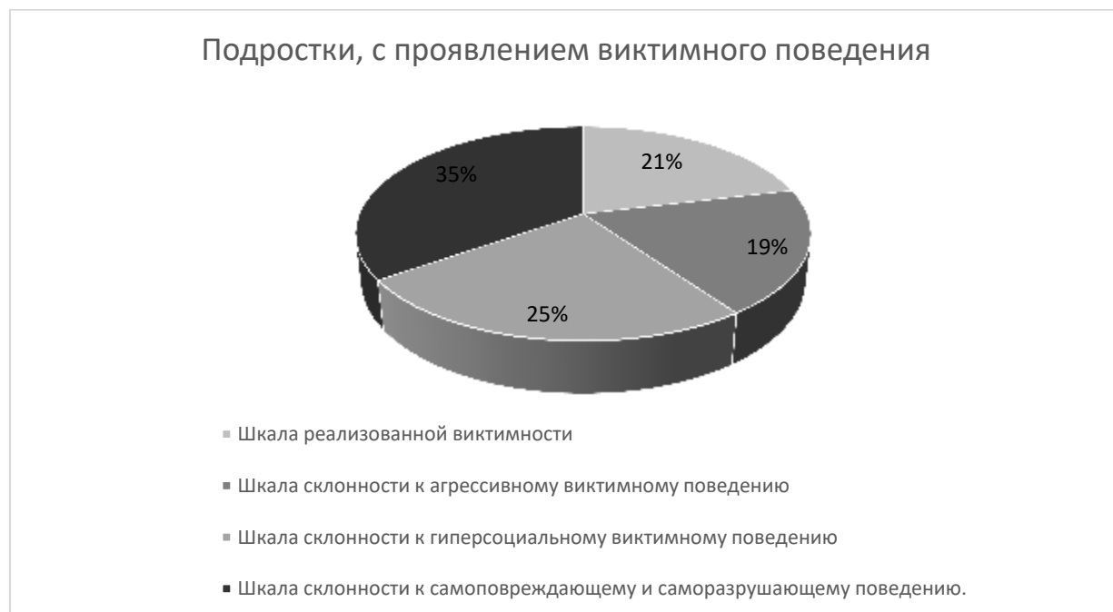
Рисунок 3. Распределение показателей по шкалам методики О.О. Андроникиной в контрольной выборке

На рисунке 3 представлено распределение показателей по шкалам методики О.О. Андроникиной в контрольной выборке.