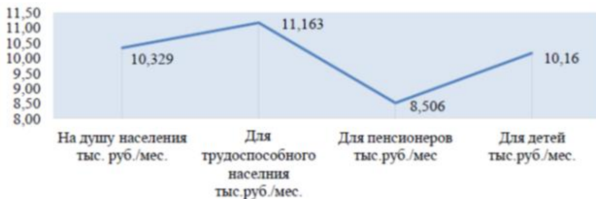
Рисунок 2 - Прожиточный минимум в РФ в 2017 г.

категорий населения представлена на рисунке 2.