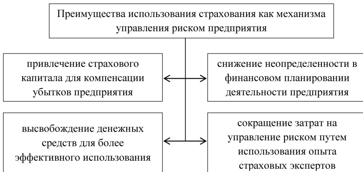
Рисунок 3 – Преимущества использования страхования как механизма управления риском предприятия

Рассмотренные виды рисков представляют не малую угрозу для предприятия. Для того чтобы минимизировать эту угрозу, предприятию необходимо принимать такие меры, которые способны обеспечить требуемый уровень страховой защиты предприятия [4]. На рисунке 3 рассмотрены преимущества использования страхования как механизма управления риском предприятия [5].