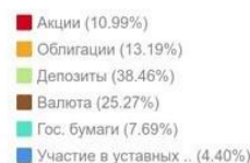
Рисунок 2 - Усредненная структура инвестиционного портфеля российских страховых организаций

Таким образом, инвестиционная стратегия управления инвестиционными ресурсами страховщика формирует значение основных критериальных оценок выбора финансовых инструментов инвестирования. Разработка инвестиционной стратегии играет значительную роль в обеспечении эффективного развития страховой организации. Но при этом страховые компании должны осуществлять свою инвестиционную деятельность, опираясь на определенные принципы инвестирования, которые закреплены законодательно. При правильно организованном подходе ведения инвестиционной деятельности страховые компании могут получать высокую отдачу от своих вложений.