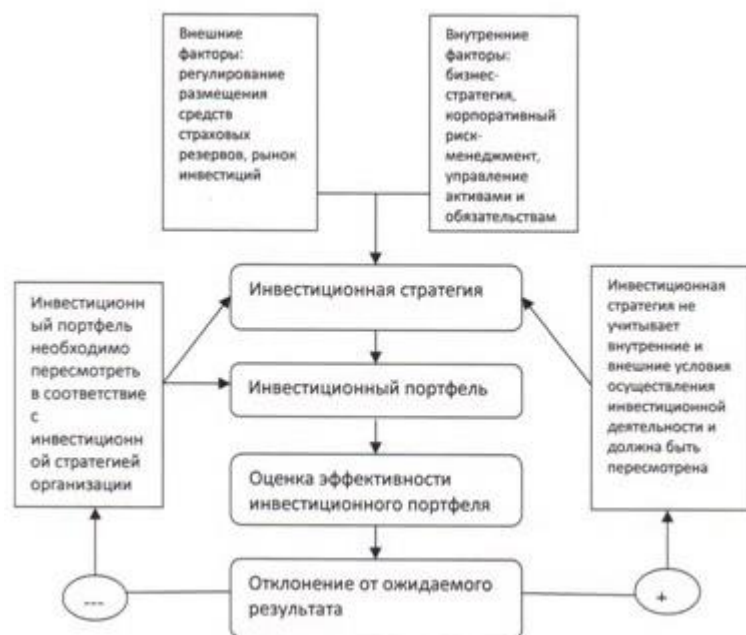
Рисунок 1 - Структура управления инвестиционным портфелем страховой компании.

Очевидно, на инвестиционную стратегию организации влияет ряд внутренних и внешних факторов, с учетом которых формируется инвестиционный портфель.