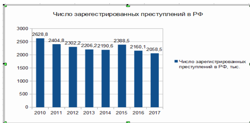
Рисунок 1 – Динамика числа зарегистрированных преступлений в Российской Федерации

В 2017 г. количество зарегистрированных преступлений в стране, по сравнению с 2010 г., сократилось на 570,3 единиц. (рис.1)