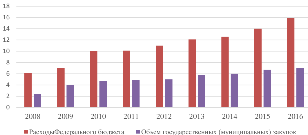
Рис. 2. Доля государственных закупок в общем объеме расходов федерального бюджета Российской Федерации, трлн. руб. 1

Отсюда следует вывод, что пропорционально ежегодному росту бюджета Российской Федерации, растут и расходы на государственные (муниципальные) закупки. А учитывая тот факт, что муниципальные заказчики занимают три четверти всей доли государственного заказа, то можно без преувеличения сказать, что государственные закупки в муниципальных образованиях оказывают существенное влияние на процесс управления муниципальной собственностью. И то, насколько корректно функционирует контрактная система в целом, зависит эффективность управления муниципальной собственностью в частности.