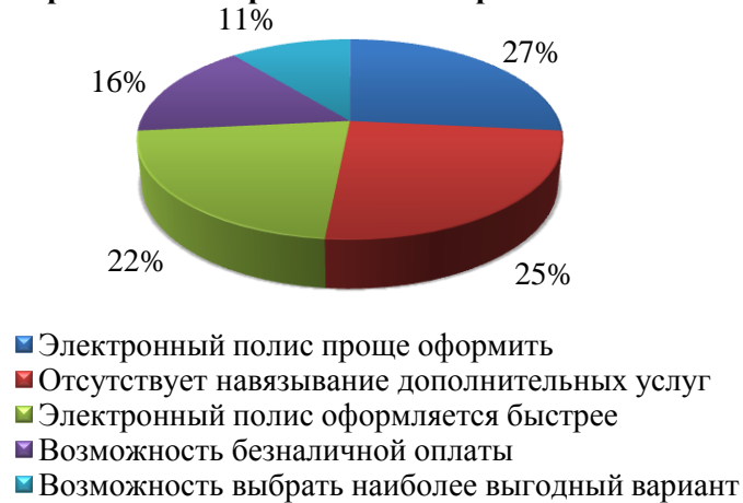
Рисунок 2 - Результаты социологического опроса

По результатам опроса (рис. 2) можно сделать вывод о том, что большинство респондентов в качестве основных преимуществ электронного полиса ОСАГО выделяют простоту и быстроту его оформления, а также отсутствие навязывания дополнительных услуг.