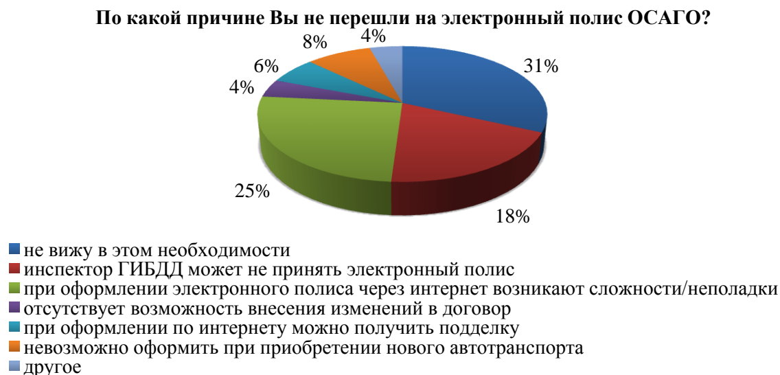
Рисунок 4 - Результаты социологического опроса

Для выявления недостатков е-ОСАГО, которые вынуждают страхователей выбирать бумажный полис, также был проведен опрос среди владельцев транспортных средств Оренбурга (рис. 4).