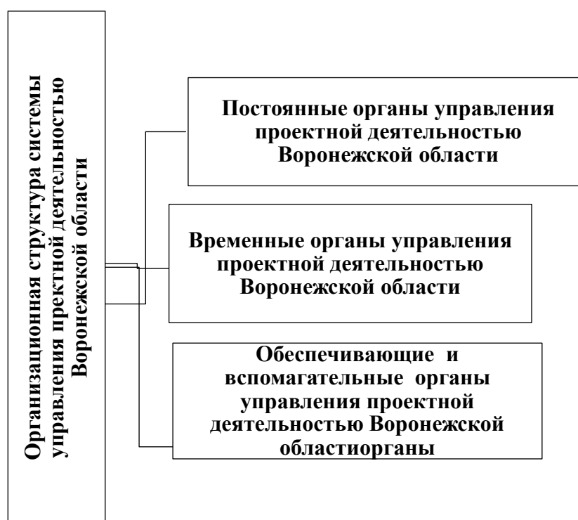
Рисунок 1 - Организационная структура системы управления проектной деятельностью Воронежской области

Согласно Постановлению Правительства Воронежской области от 08 декабря 2016 № 925 «Об организации проектной деятельности в правительстве Воронежской области и исполнительных органах государственной власти Воронежской области» организационная структура системы управления проектной деятельностью Воронежской области состоящая из постоянных органов управления проектной деятельностью, временных органов управления проектной деятельностью, обеспечивающих и вспомогательных органов управления проектной деятельностью, представлена на Рисунке 1.