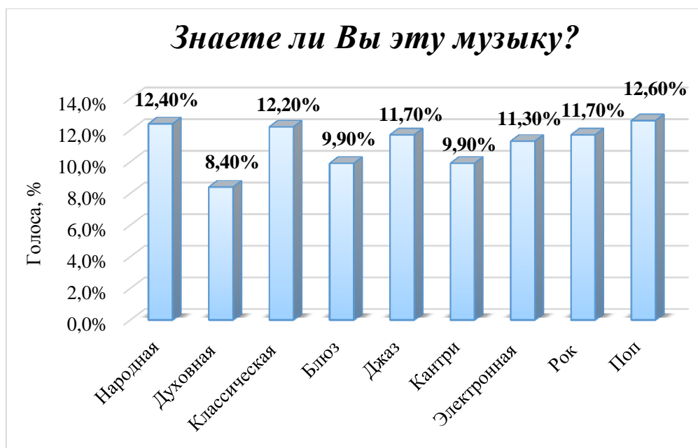
Рисунок 2 - Результаты ответов на вопрос "Знаете ли Вы эту музыку?"

Согласно результатам опроса на вопрос «Знаете ли Вы эту музыку» голоса распределились следующим образом: наиболее знакомыми стилями оказались поп музыка (12,6 %), народные и национальные мелодии (12,4 %), классика (12,2 %) и рок (11,7 %) (рисунок 2). Недостаточно знакомыми стилями являются духовная музыка, блюз и кантри.