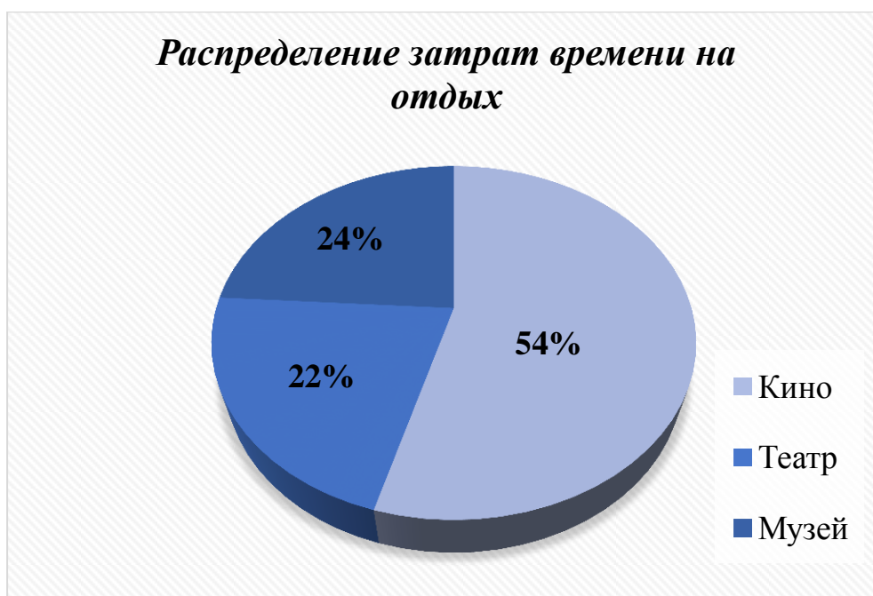
Рисунок 4 - Распределение затрат времени на отдых

Большая часть из опрошенного контингента читает художественную литературу (80 %).